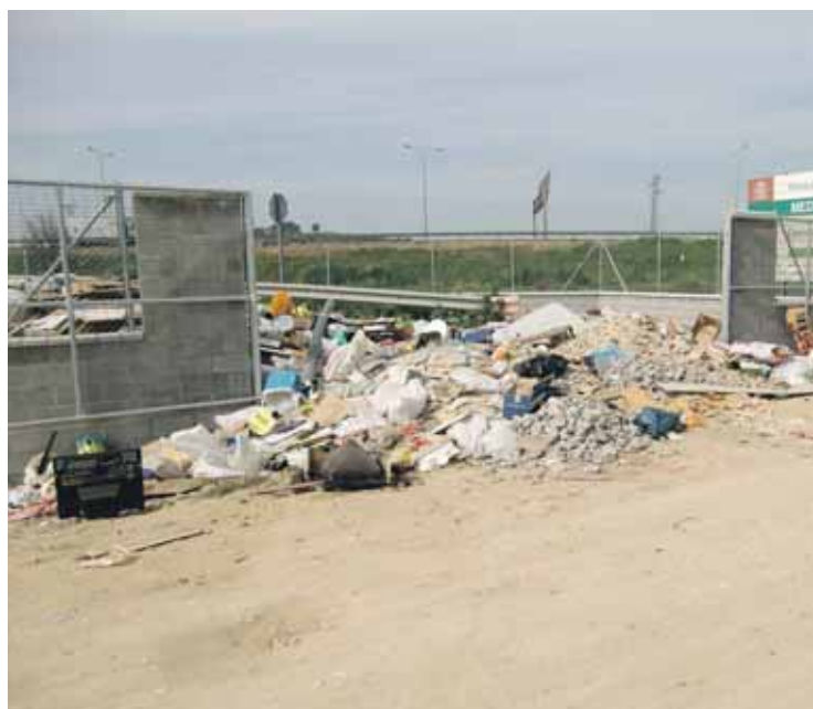
La basura y desechos ya están obstruyendo una de las entradas al punto limpio. En el interior, los escombros se esparcen sin ningún tipo de organización.

La basura y residuos están empujando a obstruir el carril de acceso. Esta es, sin duda, la consecuencia más palpable que se deriva de la falta de planificación que existe en el punto limpio de Camas. Para solucionar este despropósito, lo lógico sería contratar a algún encargado que indicara a las personas que acuden al lugar a descargar sus desechos el lugar donde deben hacerlo. De esta forma, por un lado, se conseguiría que éstos se mantuvieran siempre dentro del perímetro del Punto Verde y, por otro lado, facilitaría la maniobrabilidad de los vehículos encargados de recoger estos desechos para llevarlos a la planta residual así como el tránsito de los vecinos que acuden al punto.