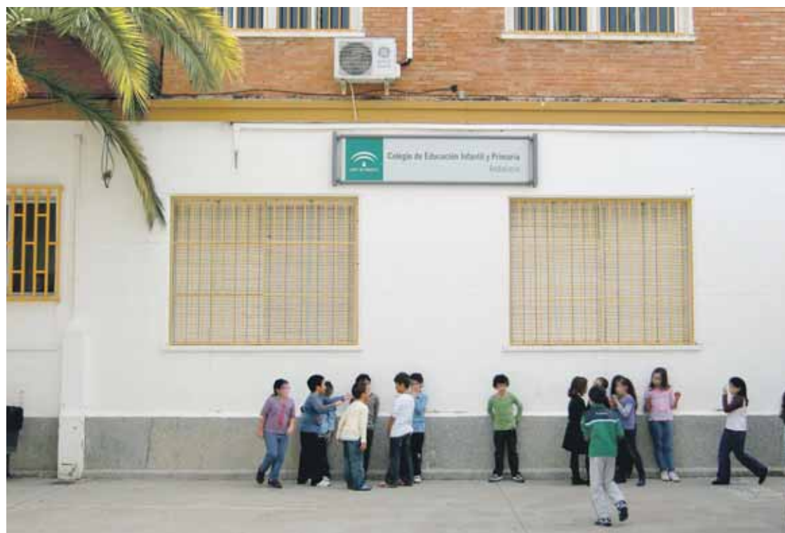
Niños y niñas durante el recreo en el CEIP Andalucía.

"Se pone en marcha el programa Aula 2.0, mediante el que se persigue extender el uso de las nuevas tecnologías entre los escolares andaluces. Igualmente se completará la implantación de las Becas 6000, como un instrumento destacado para luchar contra el abandono escolar." Buenas pala-