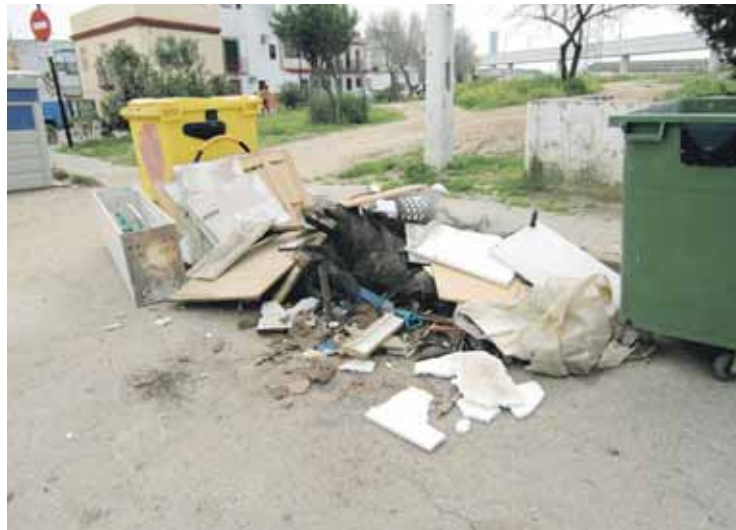
En muchos contenedores se acumulan muebles y otros desechos.

Fuentes municipales próximas a este servicio han denunciado a este periódico que una de las causas del mal funcionamiento del mismo se debe a la nula planificación y falta de coordinación con otras áreas municipales que desarrollan su trabajo dentro de un ámbito similar al abarcado por la limpieza pública, además de la falta de inversiones que el nuevo equipo de gobierno socialista ha destinado a los medios técnicos que posibilitan una mayor eficacia de esta delegación. Sin embargo, los gobiernos anteriores de IU, priorizaron en esta delegación y materializaron la adquisición de nuevos bienes en esta área. La