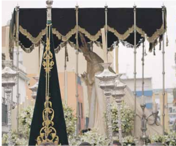
La Virgen del Rosario procesionó por Camas el pasado 20 de marzo.

En su recorrido la bella dolorosa que tallara Navarro Arteaga y portada por 35 costaleros se presentó ante la Casa de Hermandad del Rocio y