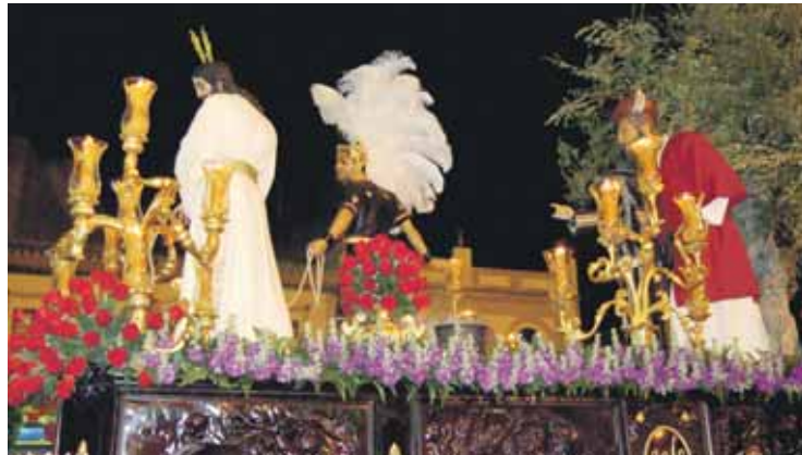
El paso del Cristo estrenó cuatro lubricanes y cuatro maniguetas.

Sobre un exorno de rosas y lirios, Nuestro Padre Jesús del Soberano Poder paseó por las calles del municipio a los sonos de la Banda de Cornetas y Tambores Sagrada Columna y Azotes (Las Cigarreras). En el Miste-