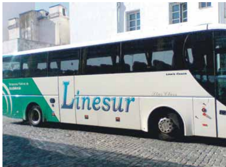
AUTOBUSES. Bollullos ha mejorado su conexión con el área metropolitana.

En la página web del Consorcio www.consorciotransportes-sevilla.com pueden consultar los horarios y recorridos de las líneas que pasan por el municipio.