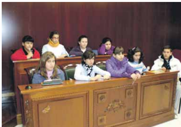
PLENO. Algunos parlamentarios durante la tercera sesión.

Durante la sesión, los parlamentarios expusieron sobre el papel un programa detallado de actividades para la Casa de la Juventud que les gustaría realizar en los próximos meses con la ayuda de la Delegación de Juventud, entre las que