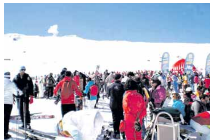
SIERRA NEVADA. Los jóvenes en una de las pistas de la estación de esquí.

Con este tipo de actividades se fomenta el compañerismo entre estos jóvenes de la comarca y además se inculca hábitos saludables como la práctica de deporte. Por ello, desde la Delegación de Juventud se agradece la participación, la implicación y el buen comportamiento de estos jóvenes.