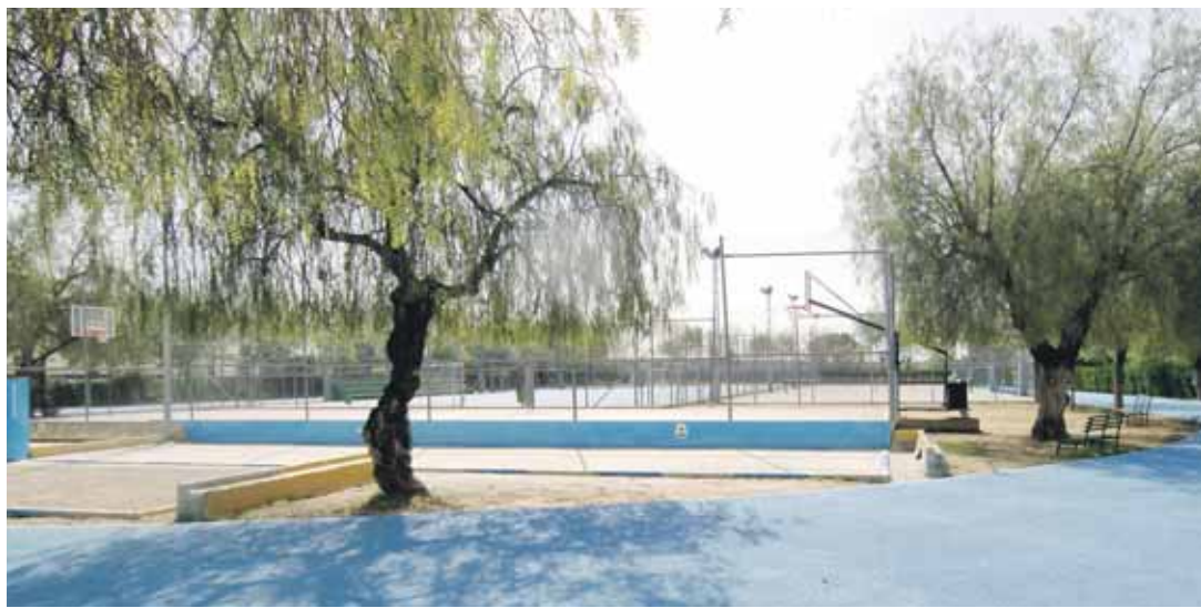
NUEVO ASPECTO. Las instalaciones del Polideportivo Municipal presentan una imagen renovada y mejor acondicionada.

El concejal informó igualmente que ya están trabajando en nuevos proyectos en las instalaciones como la adecuación de los servicios exteriores.