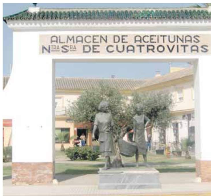
ESCULTURA. El premio ha cogido el nombre de la principal actividad agrícola.

recorrer los cerca de siete kilómetros que se separan al casco urbano de la Ermita. A lo largo del trayecto está previsto habilitar un par de paradas en las que se tomarán fuerzas y los participantes en la marcha podrán reponerse con el avituallamiento que llevará un vehículo coordinado por el Ayuntamiento.