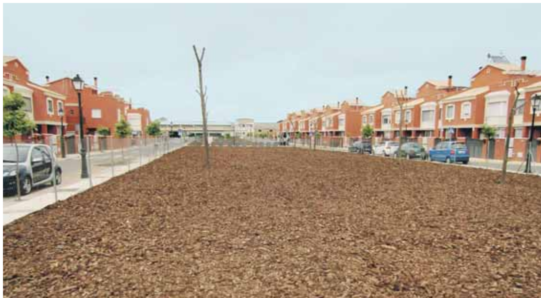
BUGANVILLAS. Aspecto en el que ha quedado una de las parcelas.

Estos terrenos han mejorado notablemente su aspecto tras las actuaciones acometidas en el vallado de todo su perímetro