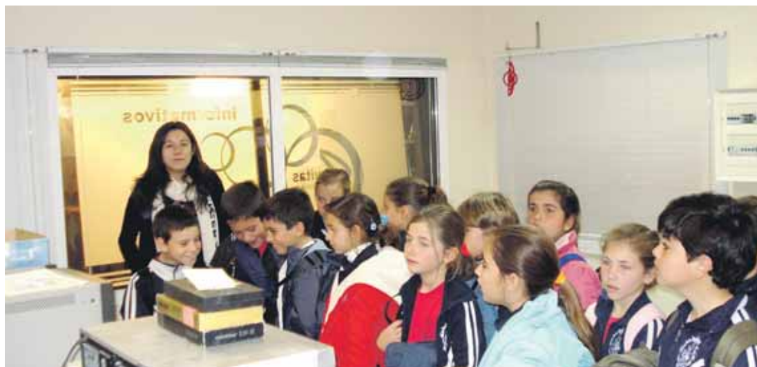
MARISTAS EN BOLLULLOS. Los jóvenes alumnos visitaron las instalaciones de Canal 4.