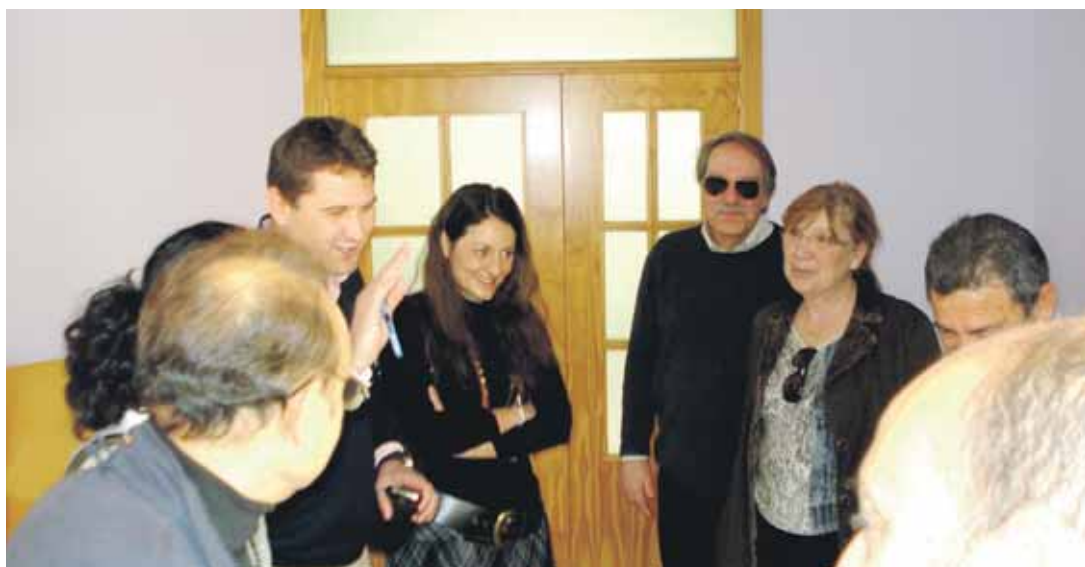
MONTETABOR. El alcalde y concejales disertan con los técnicos de la residencia de ancianos y con los mayores.

El alcalde visitó las instalaciones con su equipo de gobierno y felicitó a los responsables por la buena marcha del proyecto