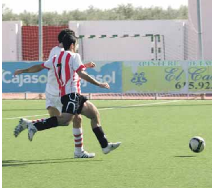
C.D. SAN MARTÍN. Un lance de un partido del equipo de Bollullos de la Mitación.

Una semana después, el San Martín disputará probablemente el partido más complicado que le resta hasta final de temporada. Los rojiblancos viajarán a Huelva para enfrentarse al equipo revelación de la temporada. El Huelva CF, equipo recién ascendido, no sólo ya ha conseguido la permanencia si no que están peleando por colarse en