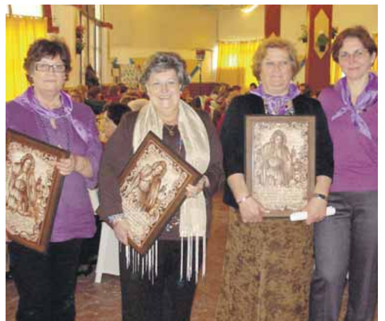
ENCUENTRO DE LA MUJER. Las presidentas recibieron un recuerdo.

Tras las actividades en la Casa de la Cultura sanluqueña, el encuentro se trasladó a la Caseta Municipal de la localidad, donde se celebró un almuerzo y donde las representantes de las distintas asociaciones de mujeres de los pueblos invitados recibieron un recuerdo del encuentro.