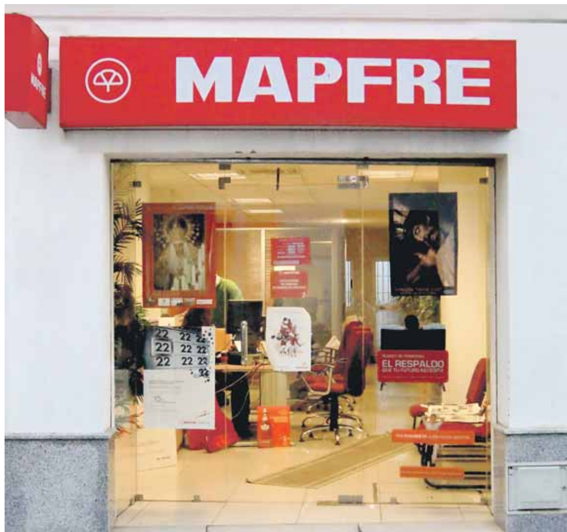
VOLUMEN DE CONTRATOS. El año pasado, esta oficina contabilizó más de 2,5 millones de euros en préstamos hipotecarios.

Nosotros desde aquí les presentamos la oferta que en nuestro municipio ofrece Vistas del Sur, una intermediadora bancaria y de seguros que trabaja para dos grupos líderes en sus respectivos sectores: Mapfre y Caja Madrid. Antes de especificar la oferta de Vistas del Sur, un dato que pone de manifiesto el volumen de negocio de