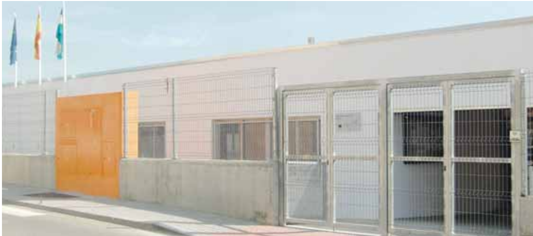
COLEGIO. En la imagen, la fachada principal del centro educativo.

El alcalde reclama a Detea, empresa adjudicataria de la Junta de Andalucía, que los arregle