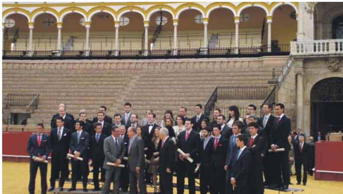
RECONOCIMIENTO. El Rey Juan Carlos I entregó los diplomas y medallas a los 25 estudiantes en la Maestranza.