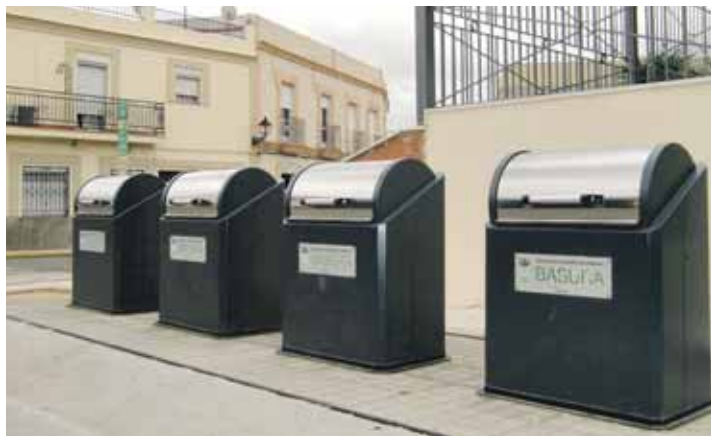
CONTENEDORES. Se han instalado por todo el municipio.