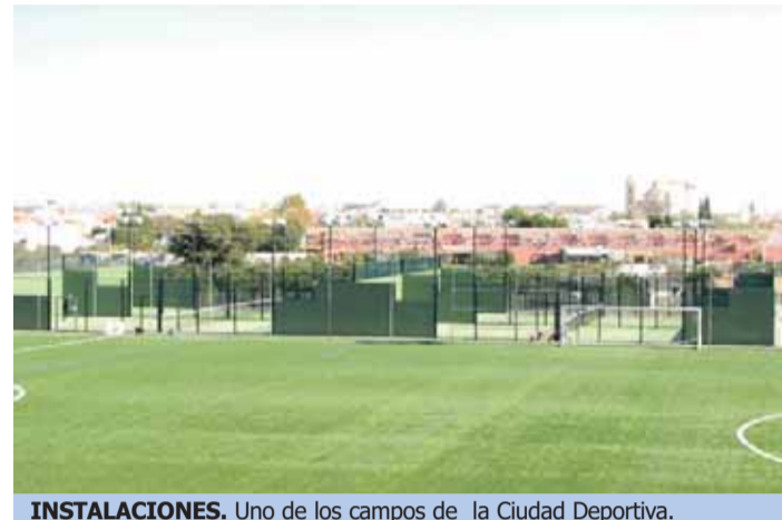
INSTALACIONES. Uno de los campos de la Ciudad Deportiva.

UMBRETE. Por la gestión de la Ciudad Deportiva Municipal