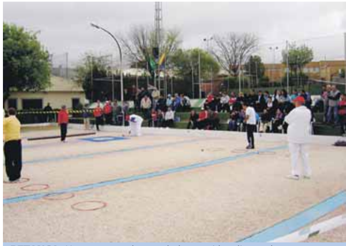
PETANCA. Un momento de una de las partidas disputadas.