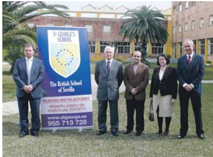
BRITISH 'S SCHOOL. Directivos del colegio con el alcalde de Sanlúcar.

El edificio, dedicado por la Congregación de Salesianos a Casa de Espiritualidad, tendrá una profunda adaptación para adecuarla a las necesidades del sistema de educación británico, y estará operativo en septiembre de 2.010. Contará con unas instalaciones amplias y modernas, tanto en el aspecto académico como deportivo, para dar respuesta a un modelo educativo del más alto nivel basado en un sistema personalizado, práctico y creativo. Dispondrá además de aparcamientos y zonas ajardinadas, así como aulas especializadas como la sala de informática y el aula de arte. Además el colegio cuenta con su propia cocina y auditorio.