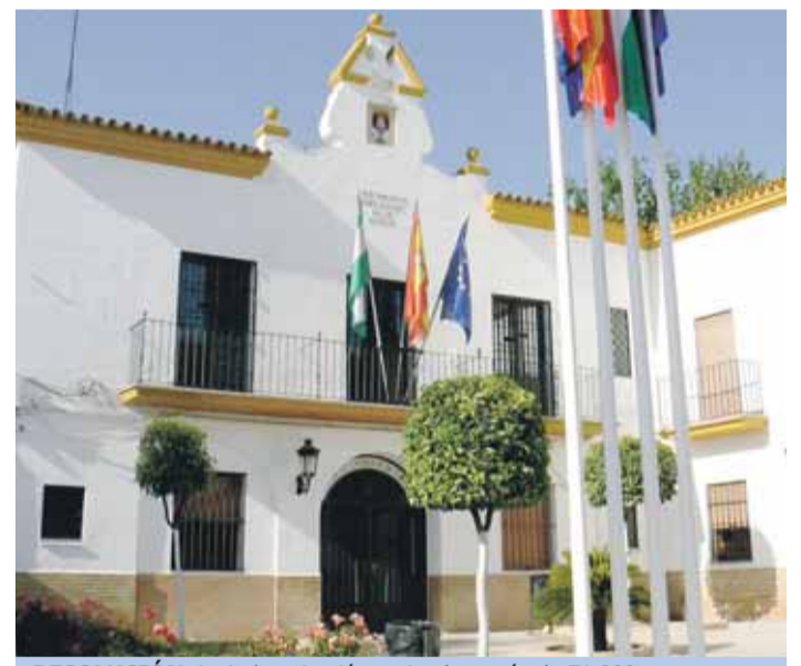
RESOLUCIÓN. La indemnización asciende a más de 71.000 euros.

"Ante esta situación hemos reclamado que sea el propio PSOE el que asuma el coste de toda esta indemnización puesto que no vamos a consentir que tengamos que ser los vecinos de Castilleja los que pagemos los tejemanejes políticos del PSOE".