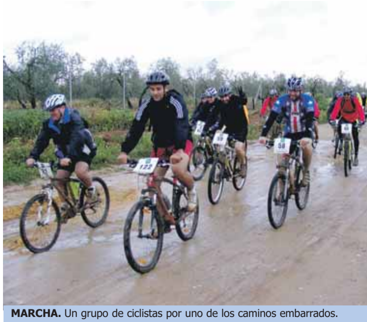
MARCHA. Un grupo de ciclistas por uno de los caminos embarrados.

A las nueve y media se daba la salida a la marcha, en la que finalmente tomaron parte unos 180 aficionados a la bicicleta, comenzando su recorrido, en primer lugar, por las calles de Gines. A un ritmo lento, y