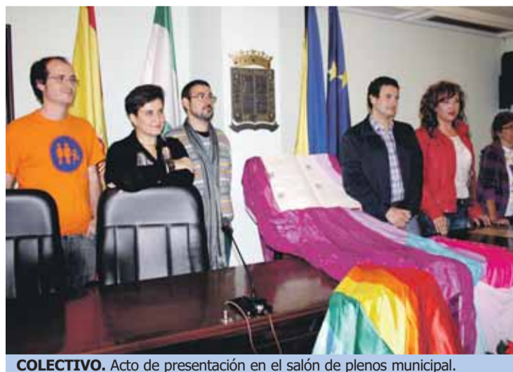
COLECTIVO. Acto de presentación en el salón de plenos municipal.

La presentación del punto LGTB estuvo presidida por el alcalde del municipio, Fernando Zamora, que destacó la importancia "de poner en marcha un punto que supone un paso más a la integración y la igualdad. Hoy es un día importante para San Juan y para los que creemos