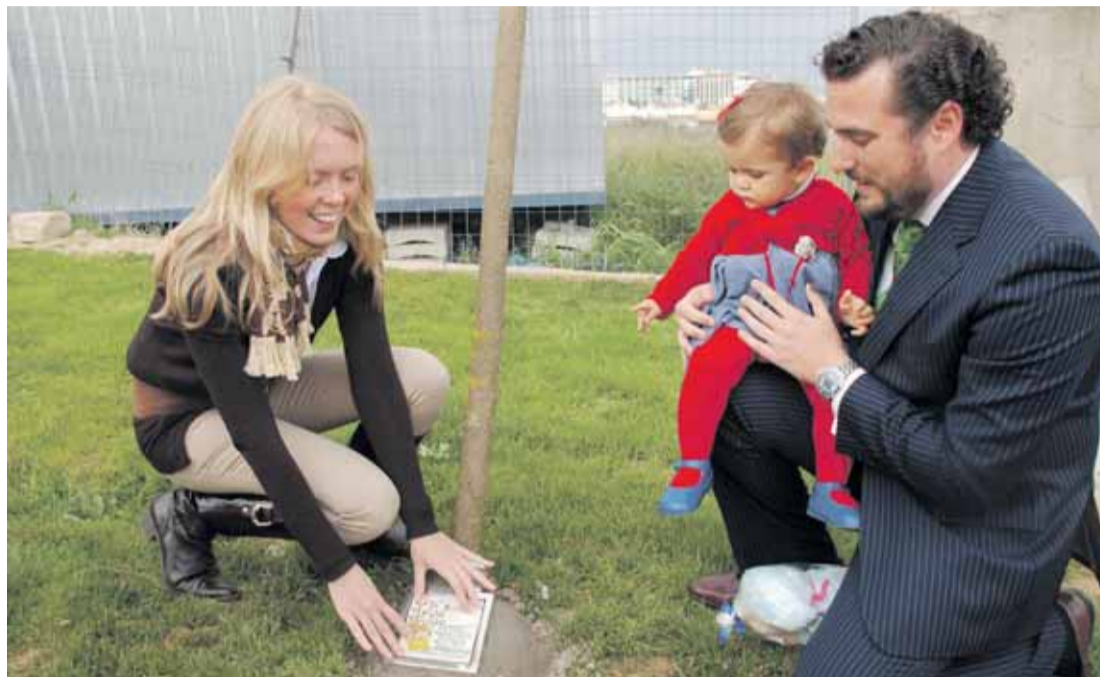
INICIATIVA. Unos padres colocan la placa de su hija en uno de los árboles plantados.

A los pies de cada árbol, los padres junto con hermanos y abuelos colo-