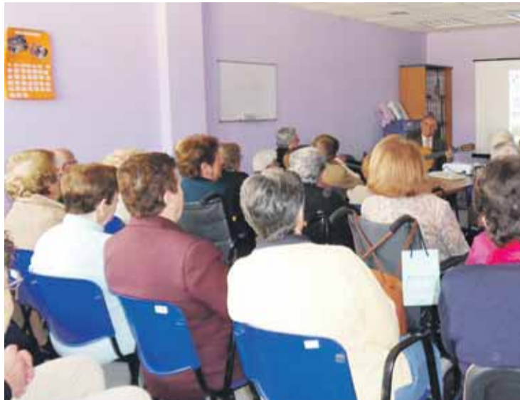
TERAPIA. Una de las sesiones de fandangos llevadas a cabo en el centro.

Y es que antes del cante, que es el colofón, el cenit de las sesiones de este taller, se profundiza en las costumbres, gastronomía y cultura del municipio, o comarca, a la que esté dedicada la sesión de ese día. De esta manera, se profundiza en la idiosincrasia del municipio en cuestión, lo que permite por otro lado una mejor asimilación de las particularidades del fandango del lugar.