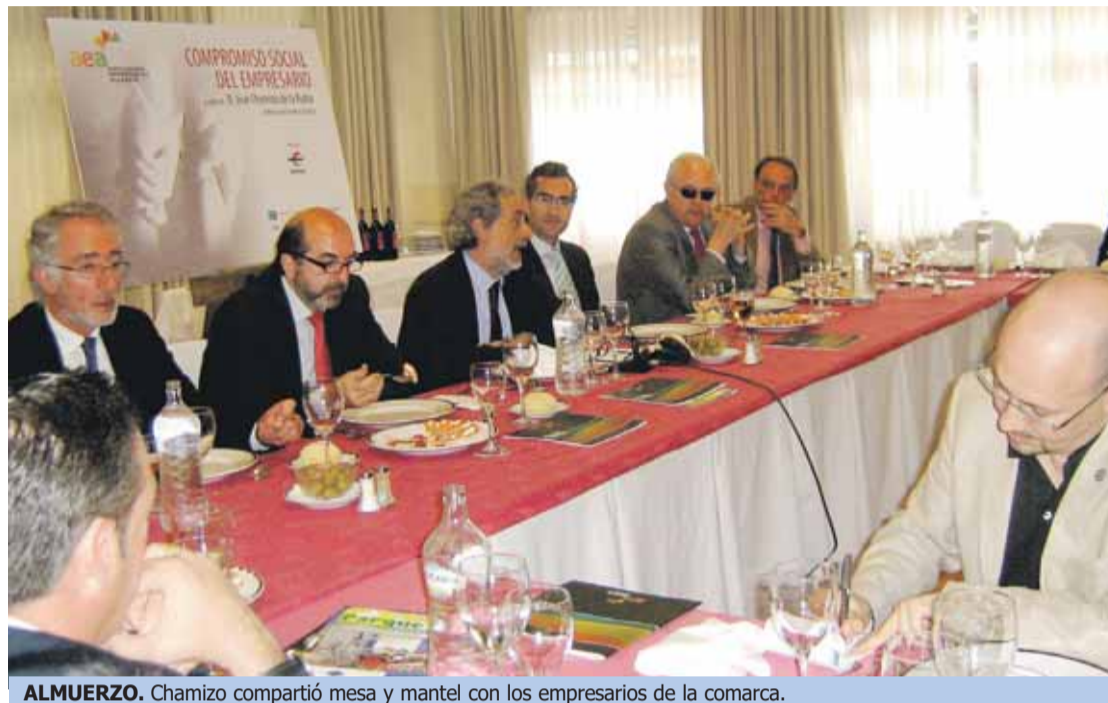
ALMUERZO. Chamizo compartió mesa y mantel con los empresarios de la comarca.

Este encuentro al que acudieron más de 100 empresarios y autoridades de la comarca se enmarca dentro del ciclo de almuerzos-coloquio que la asociación realiza periódicamente y que tiene como objetivo, por un