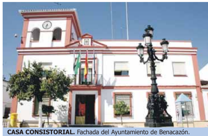
CASA CONSISTORIAL. Fachada del Ayuntamiento de Benacazón.