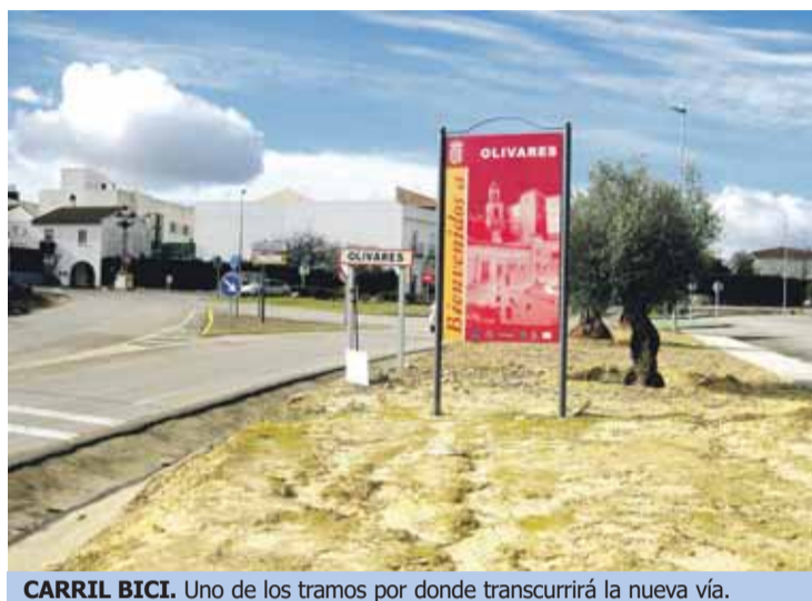
CARRIL BICI. Uno de los tramos por donde transcurrirá la nueva vía.

Fue el pasado mes de febrero cuando la empresa pública Gestión de Infraestructuras de Andalucía S.A licitó por 1,6 millones de euros este proyecto destinado a crear un carril bici entre las tres localidades aljarafeñas.