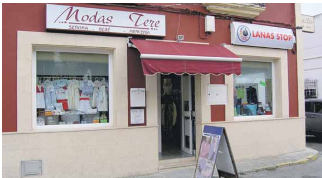
UBICACIÓN CÉNTRICA. Modas Tere está situada en pleno centro de Espartinas.