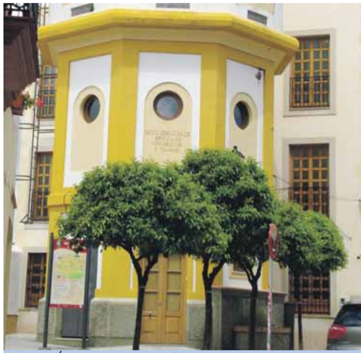
UBICACIÓN. Edificio que albergará la Oficina Turística de Bollullos.

guiadas y las posibilidades de excursión y visitas a través de Internet y con la apertura de sus instalaciones por la mañana, de 10 a 14 horas, los martes, jueves y sábado, y por las tardes, de 17 a 19:30 horas, durante los miércoles. Habrá dos rutas guiadas gratuitas al mes a las que se podrán apuntar todos aquellos que lo deseen. La de la primera semana del mes será a la Iglesia San Martín de Tours y a la Ermita de Roncesvalles, mientras que la de la tercera semana de cada mes será a Cuatrovitas.