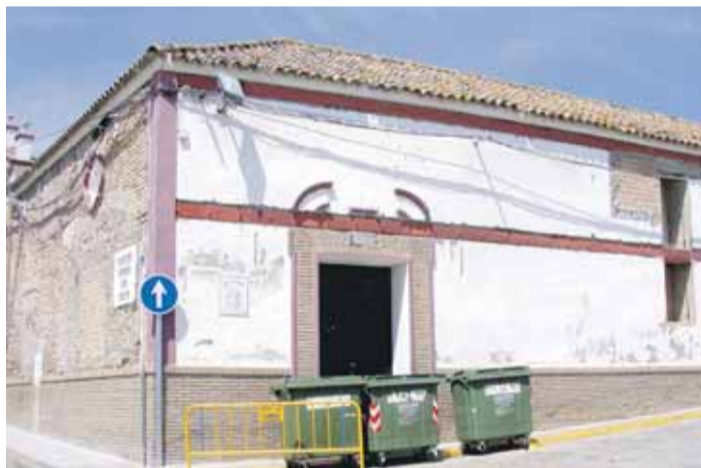
HACIENDA. Este edificio será la sede de la Casa de la Cultura.

Respecto del proyecto inicial, se han introducido algunas mejoras de importancia, como la adaptación del edificio a la nueva normativa de accesibilidad, y la instalación de un sistema de iluminación mediante leds, con lo que se pretende mejorar el ahorro energético del edificio.