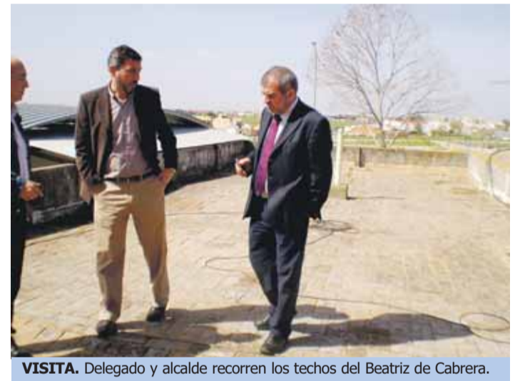
VISITA. Delegado y alcalde recorren los techos del Beatriz de Cabrera.