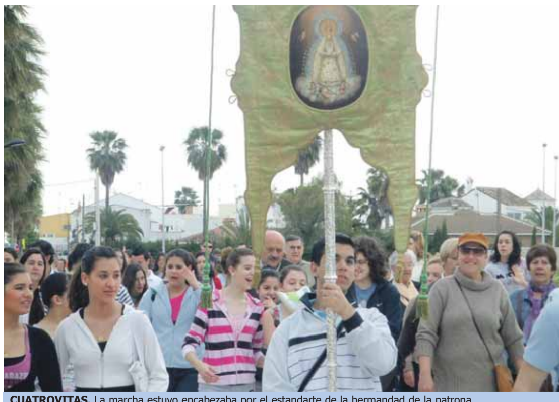
CUATROVITAS. La marcha estuvo encabezada por el estandarte de la hermandad de la patrona.

La Marcha Solidaria a Cuatrovitas ha sido organizada por