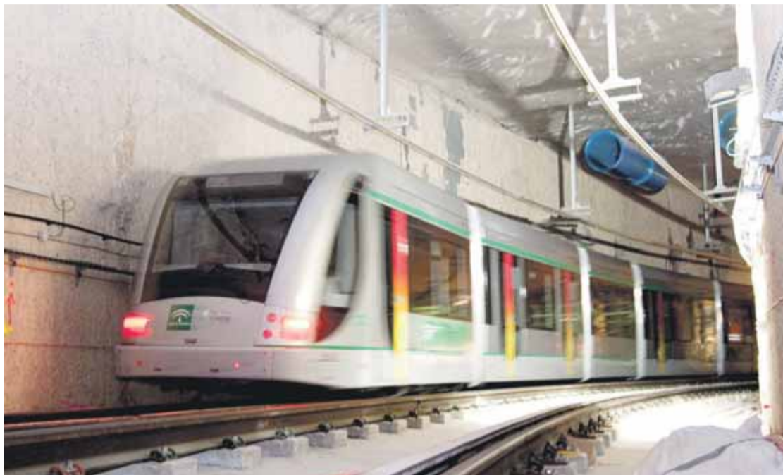
MEDIDAS ADOPTADAS. Obras Públicas recuerda que ha instalado pantallas contra la contaminación acústica.

El caso deriva de las gestiones emprendidas por un colectivo de ciudadanos de San Juan de Aznalfarache en cuanto a las molestias del funcionamiento del metro, que