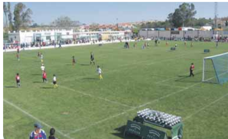
MUNDIALITO. Panorámica del campo de fútbol de La Puebla del Río.

Este VIII Mundialito se celebró en el Estadio Municipal de Fútbol San Sebastián de La Puebla del Río. El terreno de juego cigarrero recibió a más de 700 niños y niñas procedentes de prácticamente todas las localidades de la comarca, que junto a los familiares que los acompañaban, crearon un magnífico ambiente deportivo.