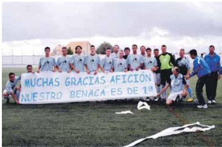
PANCARTA. Los jugadores agradecieron el apoyo de la afición.

de la Federación Sevillana de Fútbol, Pedro Borrás, hará entrega del trofeo al equipo y medallas a los jugadores, rindiéndose también homenaje a quienes fueron campeones hace 25 años. Posteriormente, la directiva y los jugadores del Benacazón C.F. ofrecerán el trofeo a la Patrona del municipio, la Virgen de las Nieves y se procederá, por primera vez, el izado de la bandera del "Benaca" en el mástil del Ayuntamiento, en reconocimiento y agradecimiento del pueblo a su equipo por tan merecido título, con el que ha batido todos los records, tanto en puntos (75) como en goles (101 a favor y 17 en contra).