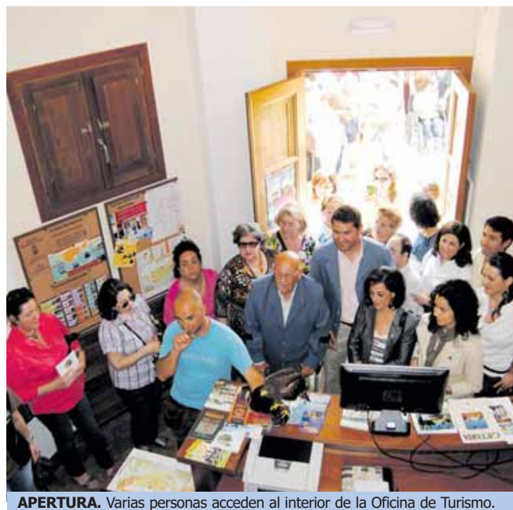
APERTURA. Varias personas acceden al interior de la Oficina de Turismo.

El regidor destacó las amplias posibilidades de Bollullos como destino turístico, algo para lo que cuenta con valores diferenciales como el Aeródromo, con escuela de aviación y de paracaidismo, el Centro Hípico y el Bosque Sus-