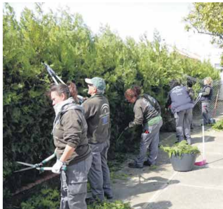
TALLER DE EMPLEO. Los alumnos realizando labores de poda.

Esta acción formativa está destinada a personas y profesionales mayores de 25 años, desempleados en general, que durante la duración del taller se formarán como alumnos trabajadores en los módulos de Trabajos Forestales y Ecoconsejeros.