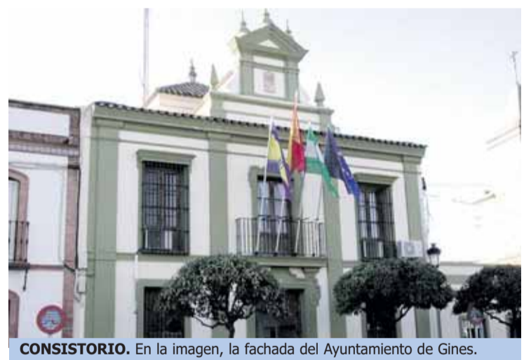
CONSISTORIO. En la imagen, la fachada del Ayuntamiento de Gines.

Los populares indicaron también que el Ayuntamiento de Gines tiene unos problemas de