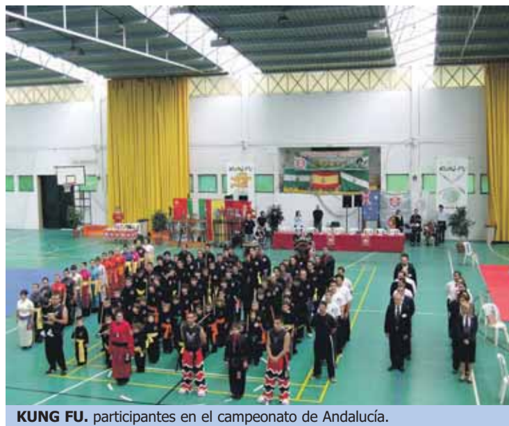
KUNG FU. participantes en el campeonato de Andalucía.