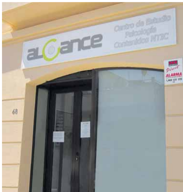
ÚNICO. Primer centro de sus características que se conoce en Andalucía.