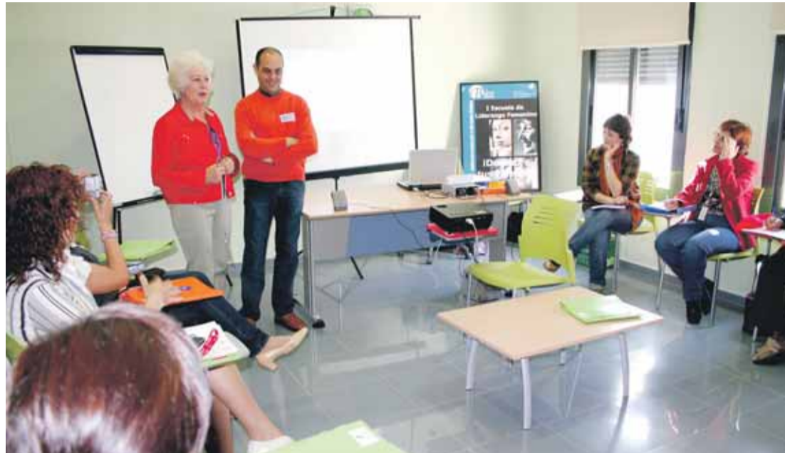
ESCUELA DE LIDERAZGO. En la imagen, un momento de la primera sesión que tuvo lugar en Salteras.

La Escuela de Liderazgo Femenino de ADAD, una acción formativa pionera en Andalucía y que también comparten políticas, técnicas de igualdad y en esta segunda edición se va a abrir a empresarias y mujeres de otras nacionalidades, pretende poner sobre la mesa las contri-