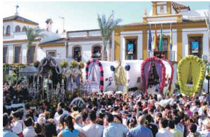
SALIDA. Las carretas delante del Ayuntamiento esperando el inicio.

Este ha sido el fruto de un intenso esfuerzo por parte del actual Equipo de Gobierno Municipal, que junto con la Hermandad del Rocío de Gines han llevado a cabo numerosas gestiones ante los