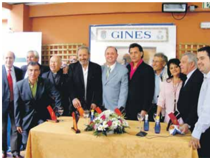
HOMENAJE. Los componentes del grupo rodeados de amigos y vecinos.