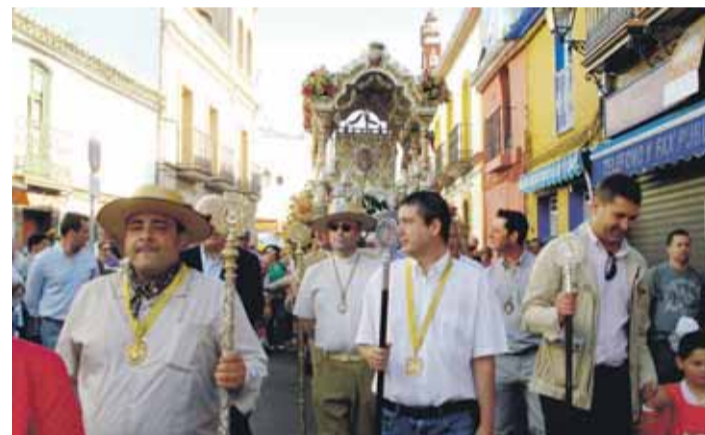
SALIDA. En la imagen, la comitiva por una de las calles del municipio.

Tras la misa de romeros en la Parroquia de San Martín de Tours se inició el camino por la calle Larga. En la ermita, la Hermandad del Gran Poder cantó la salve, posteriormente se llegó a La Juliana y se sesteó en Lópaz. Después se procedió al Cruce del Quema, uno de los momentos más destacados hasta llegar a Villamanrique, localidad sede de la Hermandad madrina de Bollullos. Así concluía el primer día de peregrinación de la Hermandad de Bollullos