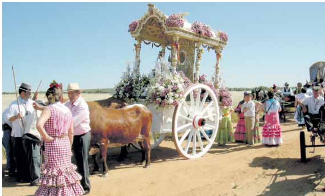
CAMINOS DE SEVILLA. El Plan Romero 2010 se mantendrá activado hasta el 27 de mayo.

El Puesto de Mando Avanzado (PMA) se ubicará, por primera vez en esta edición, en el salón de usos múltiples de Villamanrique de la Condesa, nueva infraestructura del municipio financiada por la delegación del