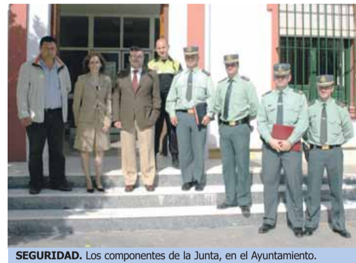
SEGURIDAD. Los componentes de la Junta, en el Ayuntamiento.

Al término de la reunión, el subdelegado del Gobierno visitó varias obras realizadas a través del Plan Estatal de Inversión Local, 8000 E, para el estímulo de la economía y el empleo, tales como cerramientos de plazas y del Polígono Industrial La Chozza y la nueva piscina de verano.