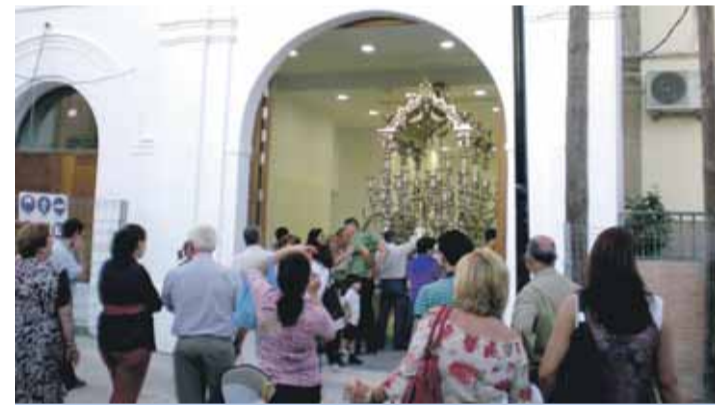
CASA HERMANDAD. La carreta fue trasladada a su nueva sede.

Fundada en 1989 como asociación, la Hermandad de Nuestra Señora del Rocío de Tomares fue reconocida canónicamente en 1993, haciéndose en 1995 filial de la Hermandad matriz de Almonte.