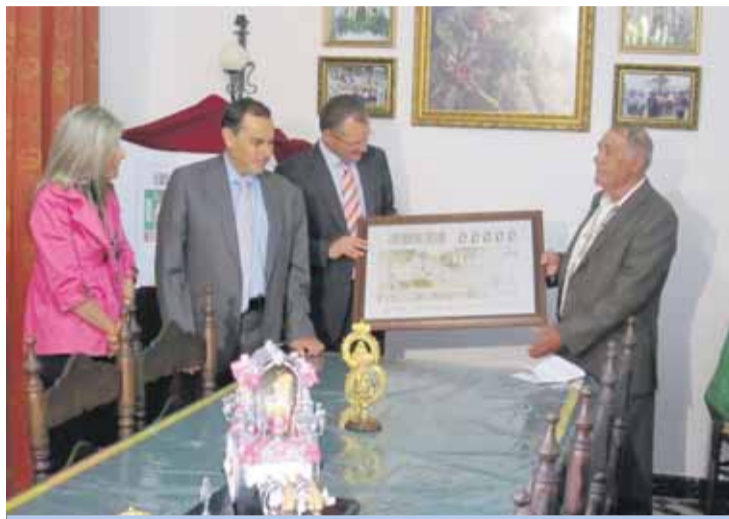
ONCE. Entrega de la plancha del cupón al hermano mayor 2010.

De esta forma, en el sorteo del sábado 22 de mayo, el cupón de la ONCE llevó la imagen de la carreta con el simpecado y la siguiente leyenda: "Hermandad Ntra. Señora del Rocío - Funda-