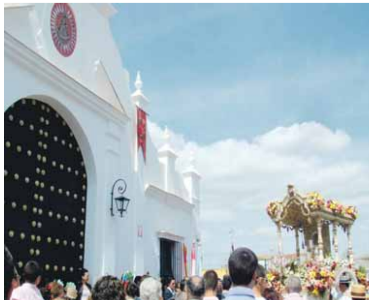
SEDE. La carreta llega a la Casa de Hermandad el día de la inauguración.

La jornada empezaba a las diez de la mañana con una misa, la Función Principal de Instituto, con la que la Hermandad cerraba los