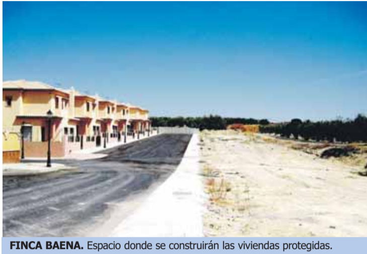
FINCA BAENA. Espacio donde se construirán las viviendas protegidas.

Cabe recordar que, con respecto a las características de las vivien-