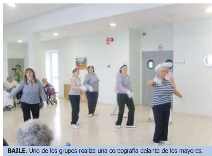
BAILE. Uno de los grupos realiza una coreografía delante de los mayores.

Tras esta actividad, en el hogar del mayor ya se trabaja en la celebración del fin de temporada.