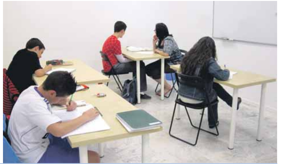
ATENCIÓN PERSONALIZADA. Una de las principales características de Alcance es que no admite más de cinco alumnos por profesor por lo que se gana en tranquilidad y atención.

CONSULTAS EN PSICOLOGÍA EDUCATIVA Y FAMILIAR Y LOGOPEDIA PARA TODAS LAS EDADES