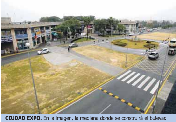
CIUDAD EXPO. En la imagen, la mediana donde se construirá el bulevar.

Las obras renovarán también todas las aceras desde Solgest, tanto en la Avenida de los Descubrimientos como en la de las Américas, hasta la rotonda de entrada a Mairena. En los 600