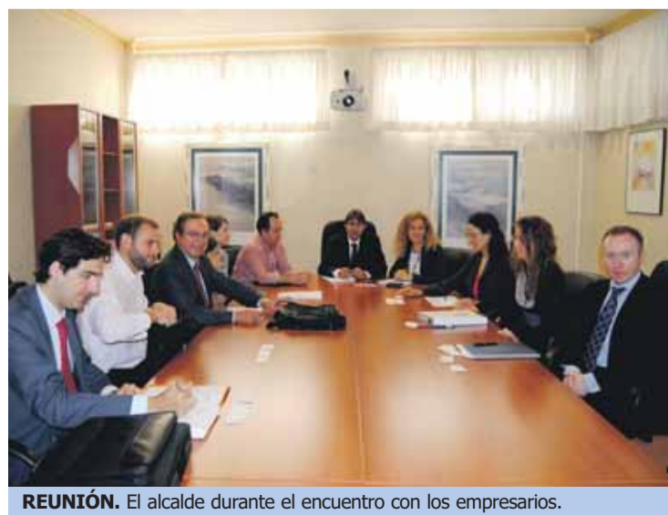
REUNIÓN. El alcalde durante el encuentro con los empresarios.

Tras la reunión mantenida a finales de abril por el alcalde con los