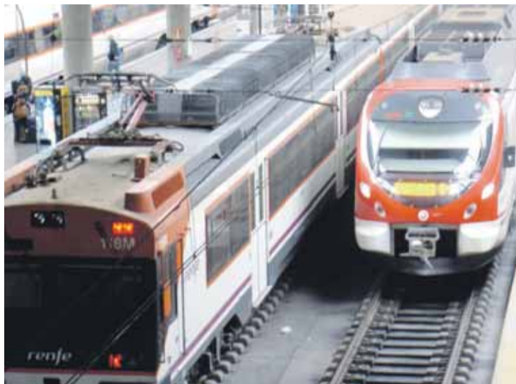
CERCANÍAS. La ampliación supondrá la creación de la línea ferroviaria C-5.

El Ministerio de Fomento informó de que el contrato adjudicado incluye las obras de infraestructura, vía y edificación necesarias para el conjunto del proyecto. Tanto la iniciativa, como los trabajos, se han dividido en dos tramos; el primero correspondiente a la conexión de los municipios aljarafeños de Camas y Salteras y el segundo al enlace de los pueblos de Villanueva del Ariscal, Olivares y Benacazón, incluyendo además las actuaciones necesarias en infraestructuras ferrovia-