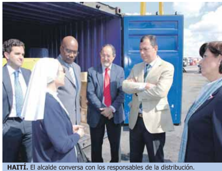
HAITÍ. El alcalde conversa con los responsables de la distribución.