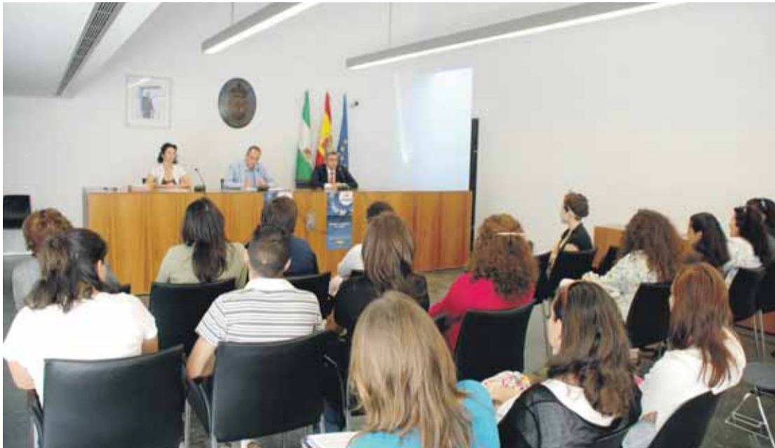
CLAUSURA. El concejal de Empleo y los técnicos de la Mancomunidad fueron los encargados de cerrar el curso.

EMPUJE AL EMPLEO. El Ayuntamiento ha generado en tan sólo tres años la creación de 600 puestos de trabajo y ha apostado decididamente por la formación