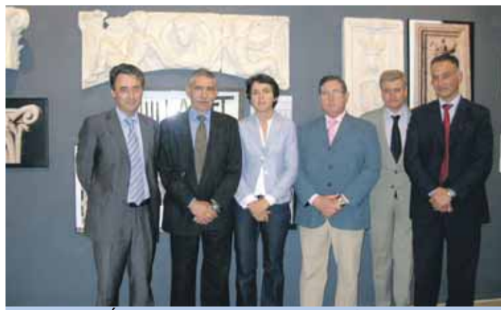
CENTRO DIDÁCTICO. Autoridades en la presentación de las mejoras.

MEJORAS. Se ha ajardinado el exterior y se ha restaurado el acceso al edificio principal, entre otras actuaciones