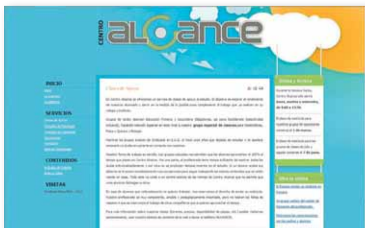
WEB. Consulte toda la información de Alcance en www.alcancesc.com

Centro Alcance es que tanto alumnos como profesores trabajan a gusto y se consiguen resultados excelentes.