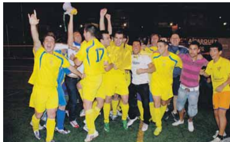
CAMINO VIEJO. Los jugadores celebraron el ascenso sobre el césped.

Tras el pitido final, el campo del Camino Viejo fue una fiesta donde jugadores y público celebraron el primer ascenso del equipo tomareño a Preferente, una celebración que se prolongó por la noche en la carpa municipal donde directiva, cuerpo técnico,