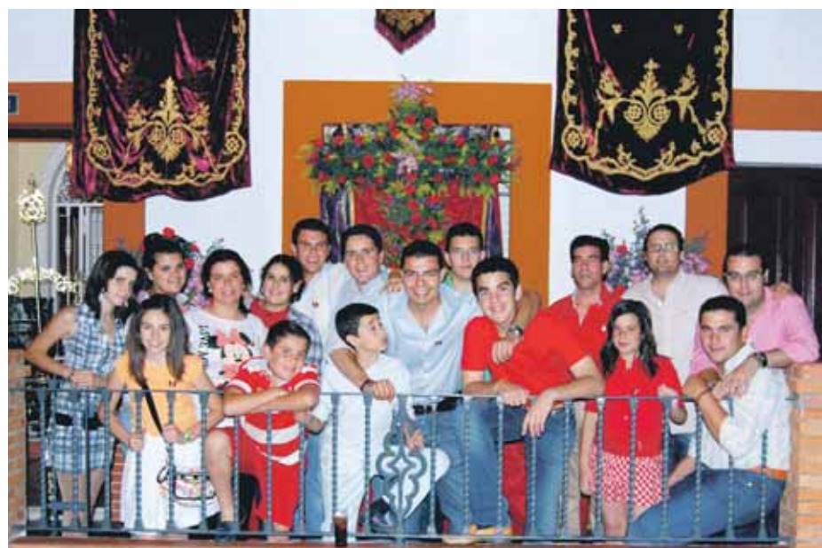
CRUZ DE MAYO. A la izquierda, el paso que la Hermandad de la Soledad sacó por las calles de Bollullos. A la derecha, el Grupo Joven de la Hermandad del Gran Poder, encargados de montar la cruz.