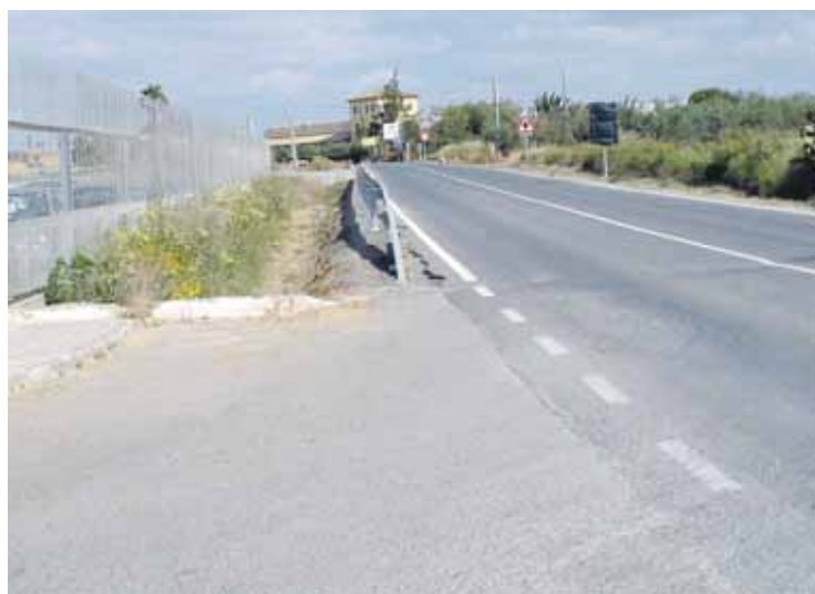
CARRETERA. Zona por la que discurrirá el nuevo carril bici.

Esta nueva infraestructura con la que va a contar Bollullos y suma-