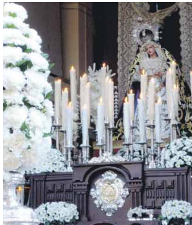
ALTARES Y NIÑOS. La Hermandad de Cuatrovitas montó por primera vez un altar para el Corpus (izquierda). El de la Soledad (derecha), ya es un clásico. Los niños de comunión desfilaron junto al Santísimo.