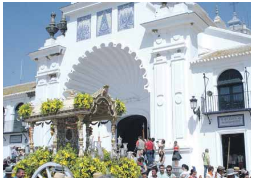
PRESENTACIÓN. Los romeros de Bollullos llevaron el cajón con el Simpecado a la puerta de la ermita mayor.