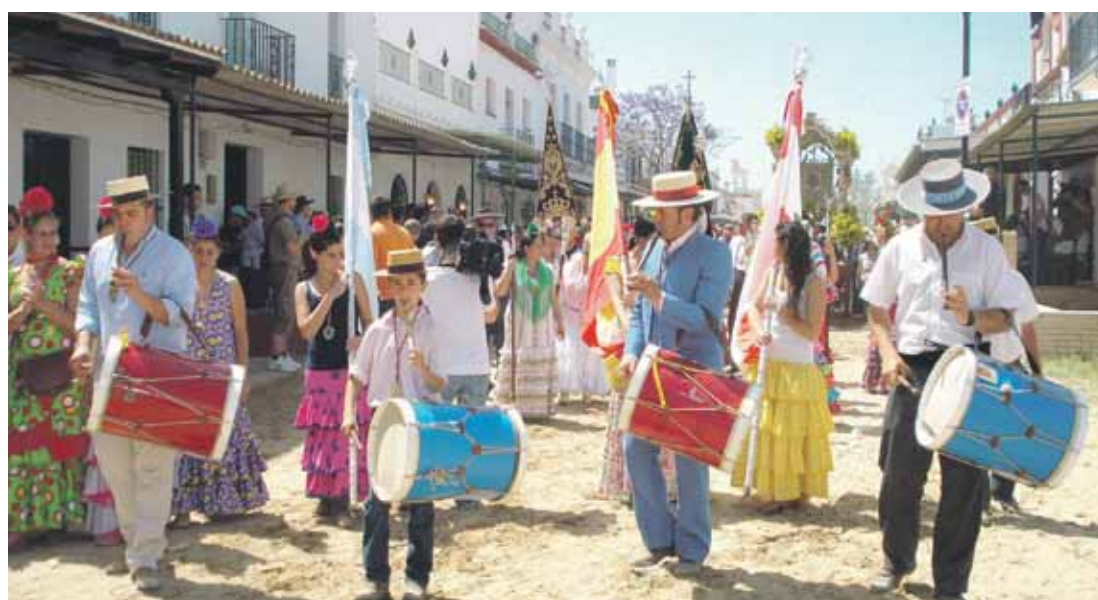
VILLAMANRIQUE Y LLEGADA. Arriba, la presentación ante la hermandad madrina. Abajo, la llegada a la aldea.

los peregrinos a la Ermita de Cuatrovititas, primera parada del camino, donde se despidieron de la patrona. Las dos hermandades, la de Cuatro-