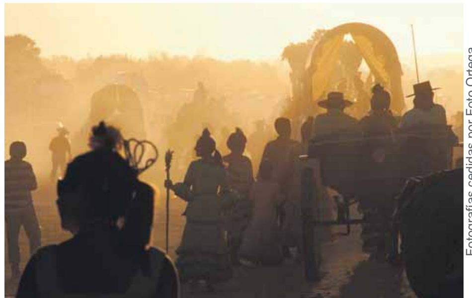
PROCESIÓN Y VUELTA. Tras el encuentro con la Blanca Paloma en la Casa de Hermandad, los romeros de Bollullos emprendían el camino de vuelta que los llevaría al municipio el 26 de mayo.