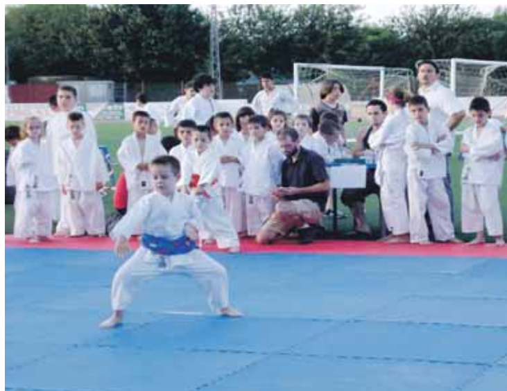
KÁRATE. A la izquierda, un momento del torneo de Palos de la Frontera. A la derecha, un alumno de la escuela local realiza una serie katas.