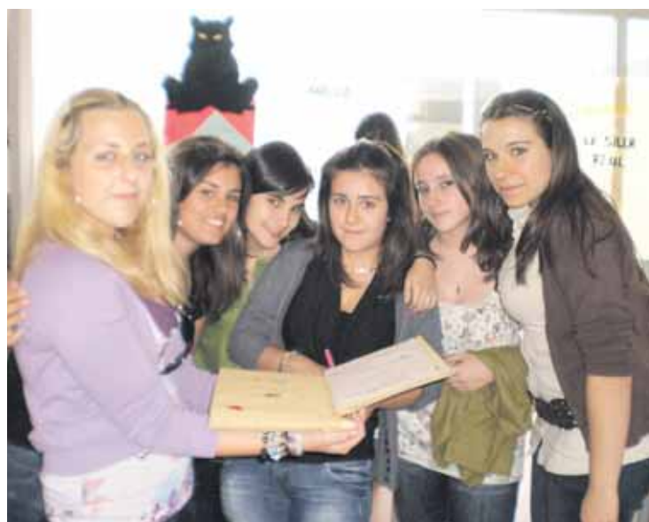
EL PLACER DE LEER. A la izquierda, las representantes de Bollullos enseñan la bandera que lució su stand. A la derecha, con el “libro viajero”.