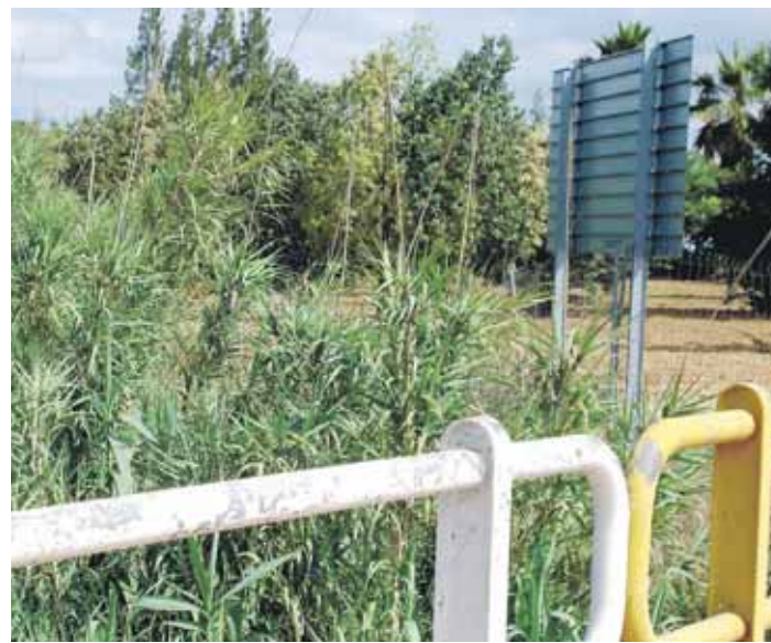
MAJALBERRAQUE. Vegetación existente en las proximidades del arroyo.

La campaña, que afectará a zonas como Las Moreras o El Redondo, atacará principalmente al tipo de mosquito conocido como "de la marisma" y se desarrollará con tres tipos de productos diferentes. Uno para las larvas mediante pastillas que se colocarán en el agua estacada, y dos productos diferentes para mosquitos en fase de crecimiento y para mosquitos ya desarrolladas que se esparcirán a través de nebulizadores.