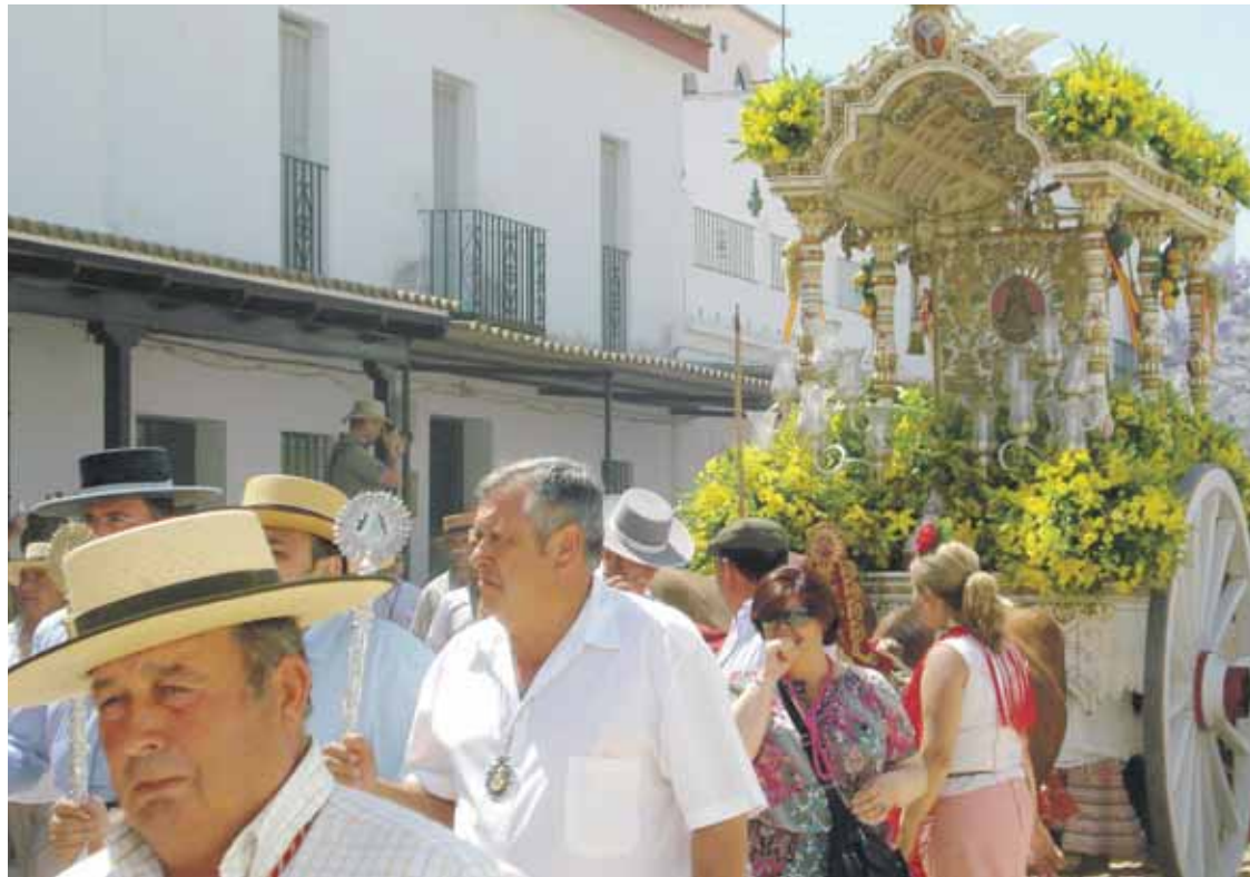
EN LA ALDEA. El paso de la Hermandad de Bollullos por las calles del Rocío fue presenciado por cientos de romeros.

Antes de este esperado momento, quedaba la jornada dominical protagonizada por la Misa Pontifical por la mañana y el Santo Rosario, a medianoche. A esa hora, el interior de la ermita era un hervidero de fieles que