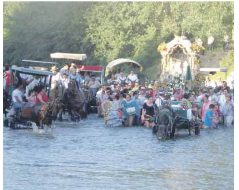
PRIMEROS PASOS. La Hermandad de Bollullos partía el 19 de mayo hacia la aldea, una jornada muy intensa donde uno de los momentos más esperados fue el paso del Vado de Quema.