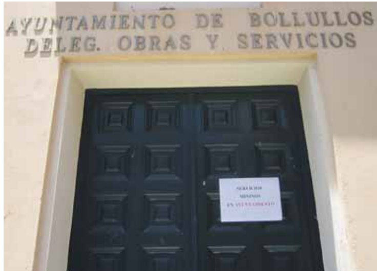
HUELGA. Cartel informando de los servicios mínimos en la Delegación de Obras.

Los trabajadores del Ayuntamiento siguieron la huelga en un 95 % aproximadamente. El Ayuntamiento contó con los servicios mínimos de Registro Municipal e infraestructuras, y funcionó con normalidad la Secretaría y la Policía Local, por lo que los servicios al ciudadano estuvieron garantizados. Incluso departamentos que trabajan con colectivos especiales, como los de Ayuda