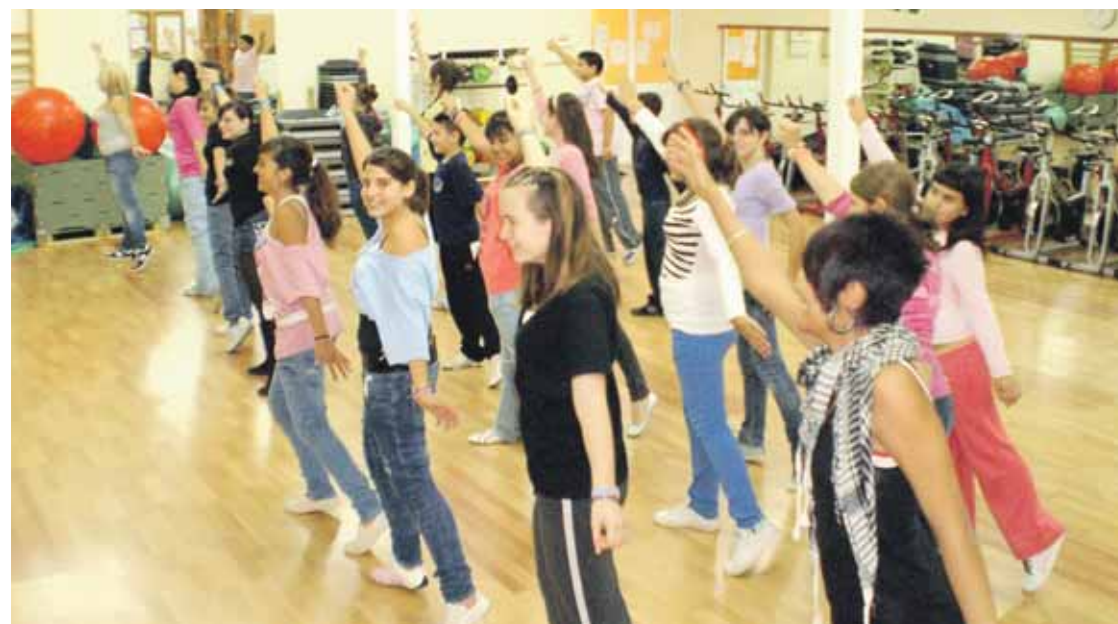
TALLER DE FUNKY. Un grupo de alumnos baila una coreografía en una de las clases.

Las clases se impartieron esta temporada los martes y jueves de seis y